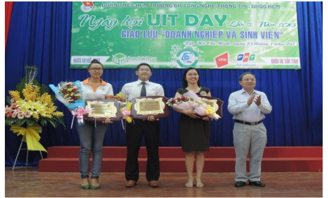
Ngày hội việc làm UIT Day II - 2013