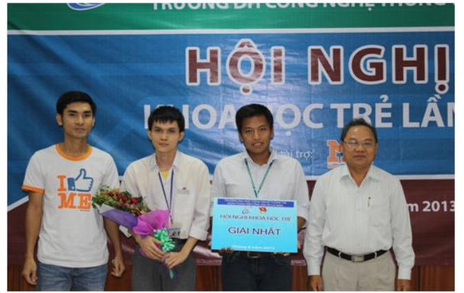
Hội nghị Khoa học trẻ (tháng 10-11 hàng năm)