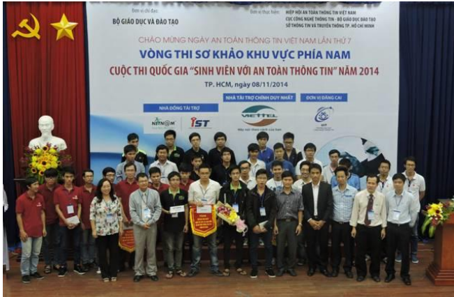
Cuộc thi quốc gia “Sinh viên với an toàn thông tin” năm 2014