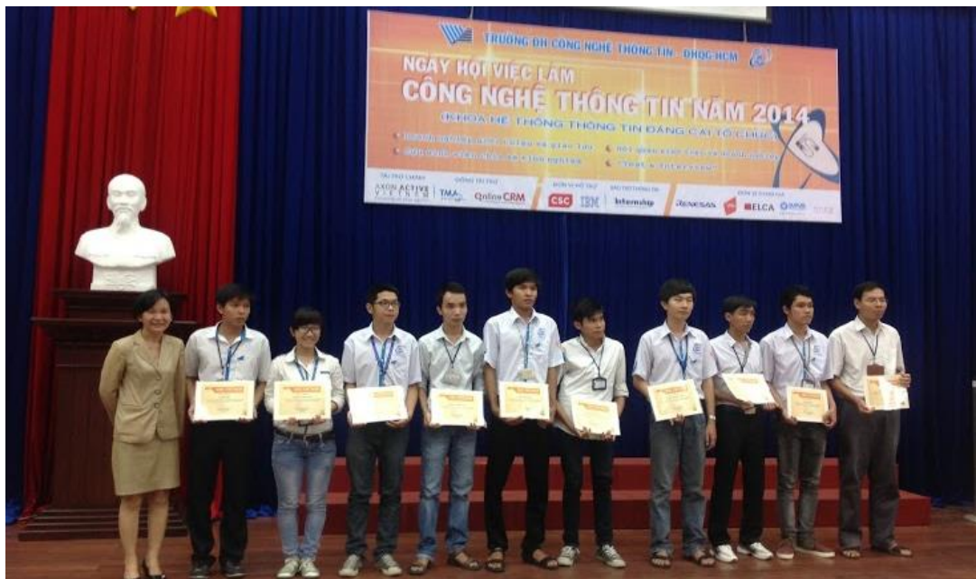
CSC Việt Nam trao tặng 10 suất học bổng cho sinh viên có thành tích học tập tốt