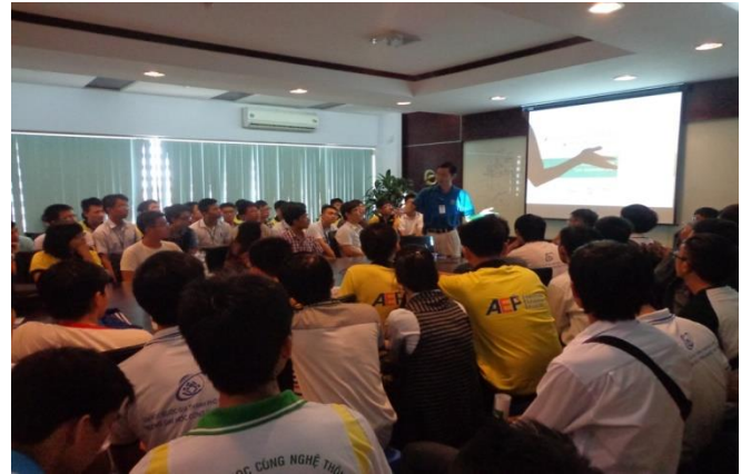
Kiến tập tại công ty Global CyberSoft