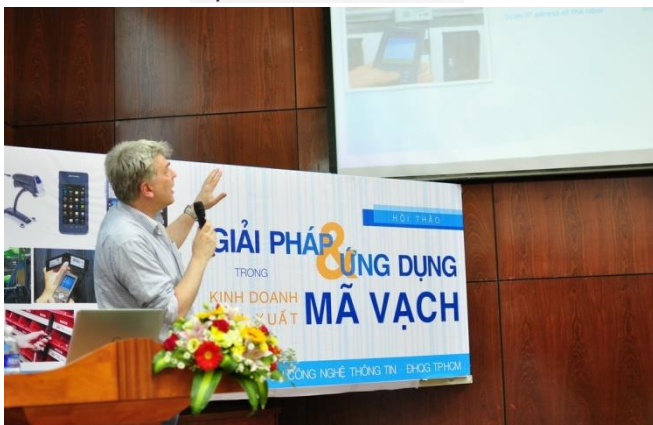
Hội thảo "Giải pháp và ứng dụng mã vạch trong kinh doanh, sản xuất"