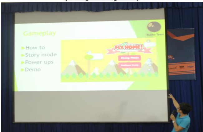
Cuộc thi Game UIT Hackathon (tháng 5 hàng năm)