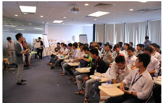
Tham quan tại GameLoft