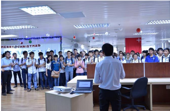
Sinh viên 5 tốt tham quan Axon Active Việt Nam