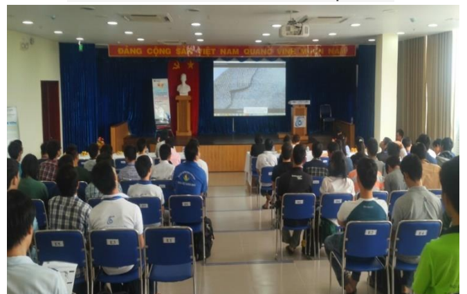
Hội thảo Kỹ năng phỏng vấn, xin việc - GameLoft