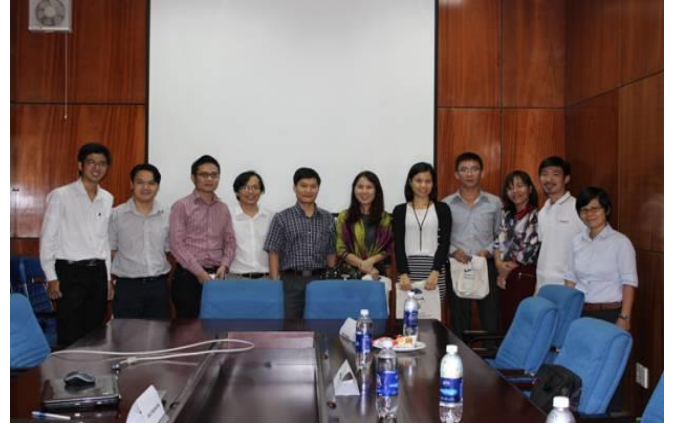
Hội thảo Kết nối doanh nghiệp và sinh viên