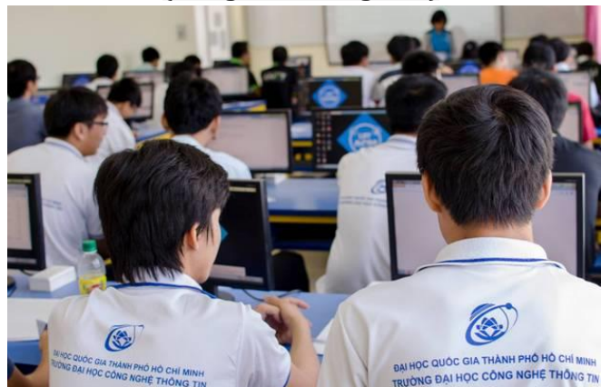
Cuộc thi Lập trình thuật toán – UIT ACM (tháng 4, tháng 9 hàng năm)