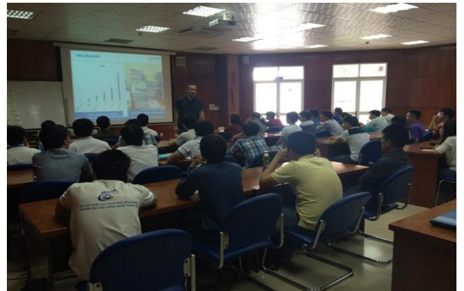
Scrum Course – Axon Active Việt Nam