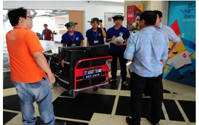
VNG đồng hành cùng chương trình “Máy tính cũ - Tri thức mới”