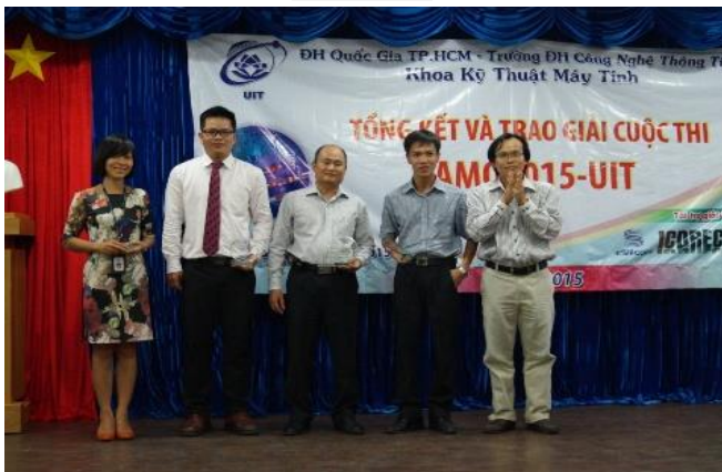
Vòng thi Quốc gia Lập trình vi điều khiển AMO (tháng 4 hàng năm)