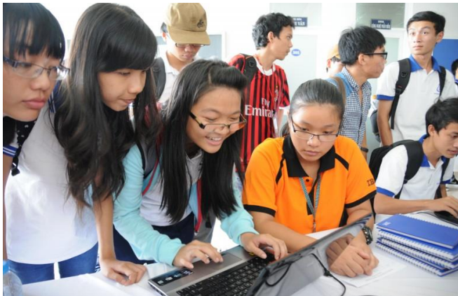
Hội thảo IBM Bluemix