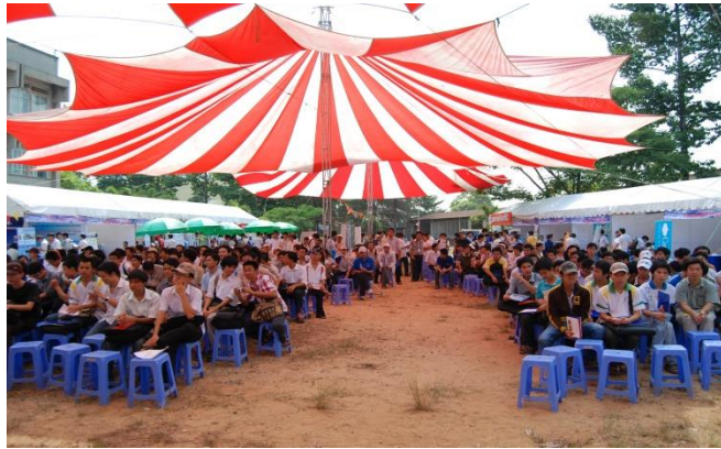
Ngày hội việc làm UIT Day I - 2010