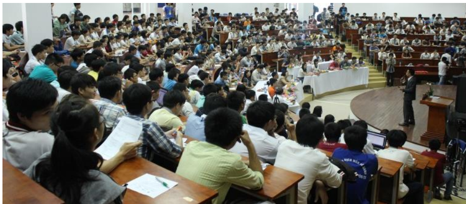
Ngày hội việc làm Công nghệ Thông tin - 2014 (Khoa Hệ thống Thông tin đăng cai tổ chức)