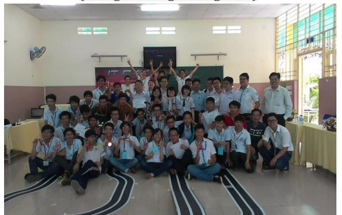
Cuộc thi Lập trình điều khiển – IT Car (tháng 5 hàng năm)